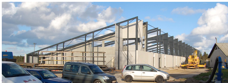
Et Realdania-støttet svinestaldsanlæg opført ved Hjørring

Bygningsanlægget ved Hjørring er målrettet svineproduktion, søer og smågrise. Bygningerne er opført i asymmetriske bygningsprofiler med selv bærende rammekonstruktioner af stål. Da avl af smågrise kræver stabil varme, er staldene velisolerede.