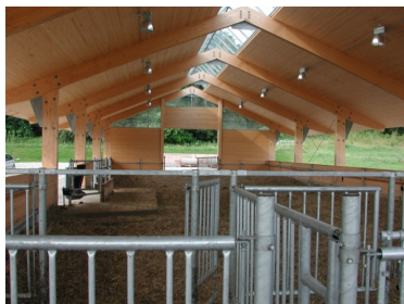
Klimaskærm opbygget af limtræsrammer og loft/tag af massive limtræselementer afdækket udvendigt med pap.