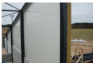
Et isoleret sandwich-element i den øverste del af svinestaldsbyggeriets gavle

Bygningsanlægget ved Hjørring er målrettet svineproduktion, søer og smågrise. Bygningerne er opført i asymmetriske bygningsprofiler med selv bærende rammekonstruktioner af stål. Da avl af smågrise kræver stabil varme, er staldene velisolerede.