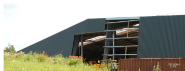
Bygningen er beklædt med tyndpladeprofiler i stål, monteret på åse og profileret i tyndpladestål. Et skelet med en "tynd hud" som klimaskærm

Spørgsmålet er, om denne type og dette bygningsdesign af en lade- og værkstedsbygning er mere bæredygtigt end det traditionelle halbyggeri.