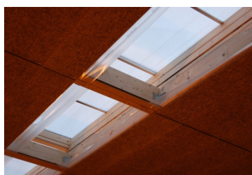
Præfabrikerede og isolerede tag- og loftselementer, med påbyggerde lysbånd

Staldbyggeriets råhus/klimaskærm er konstrueret af præfabrikerede og isolerede betonelementer med en meget robust og rengøringsvenlig, indvendig overflade. Oven på gavlenes betonelementer er der monteret velisolerede sandwich-elementer med mineraluld mellem tyndplader af stål. Det ret store og naturlige lysindtag i tagfladen giver en klar besparelse i eludgifterne til den kunstige belysning.