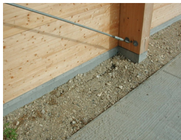
Punkt- og sribefundamenter er opbygget af præfabrikerede betonelementer. Massive træelementer udgør ydervæggene.

Byggeriet - en åben kvægstald - er et forsøg på at udvikle præfabrikerede og fleksible standardelementer, som hurtigt kan monteres, udbygges og afmonteres. Anvendelsen af træ, stort set fra sokkeloverkant og opefter, har yderligere to formål: