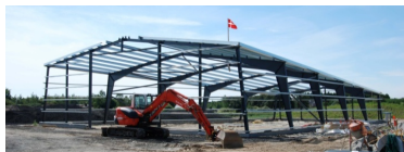
Et projekt med optimerede stålrammer, en konstruktion som giver det mindste antal kg stål pr. m 3 bygningsvolumen i forhold til standardhaller